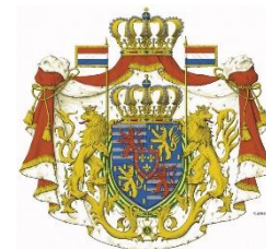
Grandes armoiries du Grand-Duc