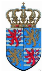
Petites armoiries du Grand-Duc

Lors de l'accession au trône du Grand-Duc Henri, le nouveau souverain fixe ses petites, moyennes et grandes armoiries qui remplacent celles utilisées depuis 1898. Les nouvelles armoiries se bornent à l'essentiel, le Grand-Duché de Luxembourg et la famille de Nassau. Copiant des détails des armoiries nationales du Grand-Duché, les nouvelles armoiries du Grand-Duc Henri reflètent le chef d'État moderne conscient de la réalité politique actuelle.