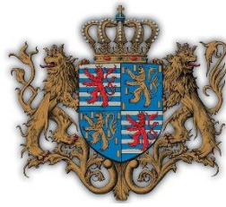
Mittleres Wappen des Großherzogs