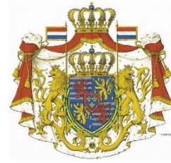
Großes Wappen des Großherzogs